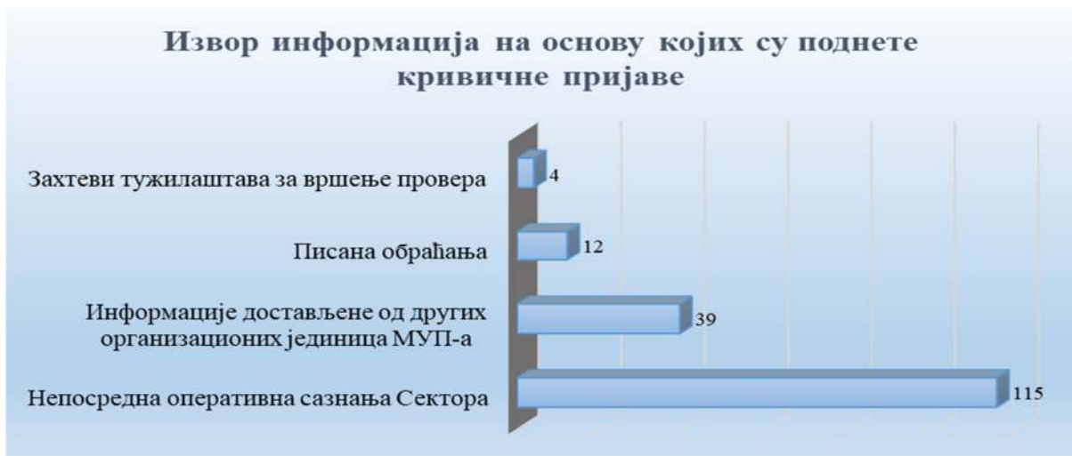
Grafikon broj 2

Najveći broj krivičnih prijava (oko 67,6%) podnet je nakon neposrednih provera operativnih saznanja do kojih su, prilikom postupanja po službenoj dužnosti, dolazili policijski službenici Sektora. U cilju razmene operativnih podataka i sprovođenja sveobuhvatnog postupka provera, ostvarena je saradnja sa drugim organizacionim jedinicama Ministarstva, što je u određenim slučajevima rezultiralo zajedničkim radom i podnošenjem pet krivičnih prijava (sa OBPK-UKP; PU u Novom Sadu; PU za grad Beograd; PU u Novom Pazaru i PU u Kruševcu).